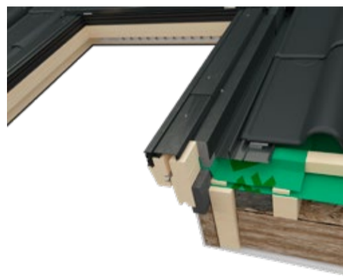
FTP-V U5 EHV-AT 006